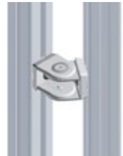
Gelenk 25/ 1" Pivot Joint 25/ 1"